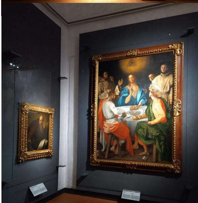
Pontormo e Rosso Fiorentino