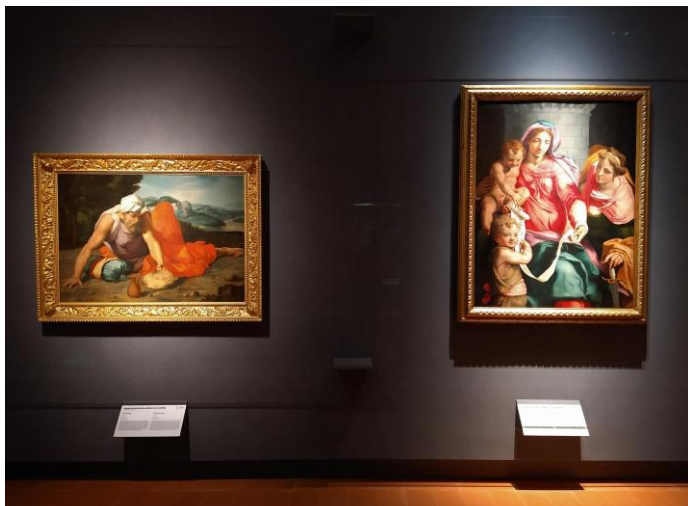
Daniele da Volterra: Sacra famiglia con Santa Barbara – Elia nel deserto