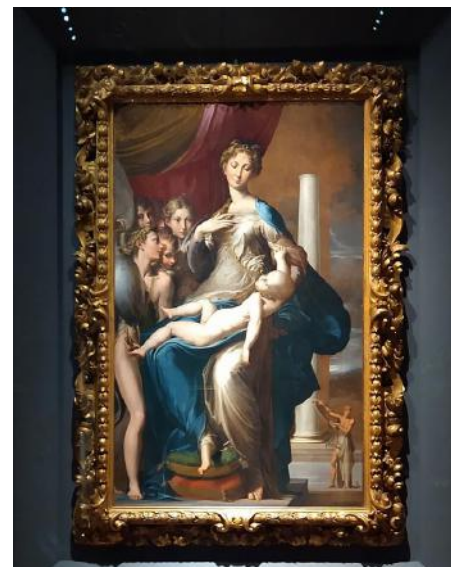
Parmigianino: Madonna dal collo lungo

Interessante sarà anche sperimentare il nuovo percorso del museo fiorentino, con il nuovo ingresso approntato nelle ultime settimane del lockdown del 2021: i visitatori, scendendo dal secondo piano attraverso la scala Buontalenti arriveranno nelle nuove sale e da qui proseguiranno la visita verso gli ambienti del '500 veneziano aperti nel 2019.